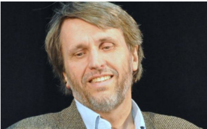
Jyväskylän yliopiston professori, Tapio Puolimatka. Artikkeleihin liittyvä kuva

LÄHDE: OikeaMedia/Jukka Rahkonen 01.11.2018